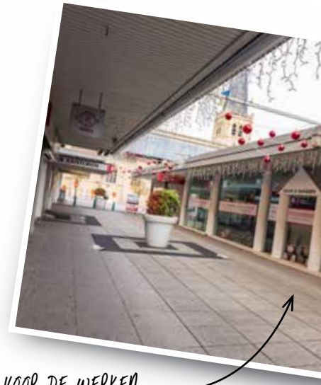
VOOR DE WERKEN

Wat je wil heropbouwen, moet je eerst afbreken. De afbraakwerken voor de broodnodige hernieuwbouw van winkelcentrum Het Pand zijn sinds begin februari op gang. Het einde van de werkzaamheden is voorzien in augustus 2022. Tijdens deze periode is er hinder in de omgeving rond de werf.