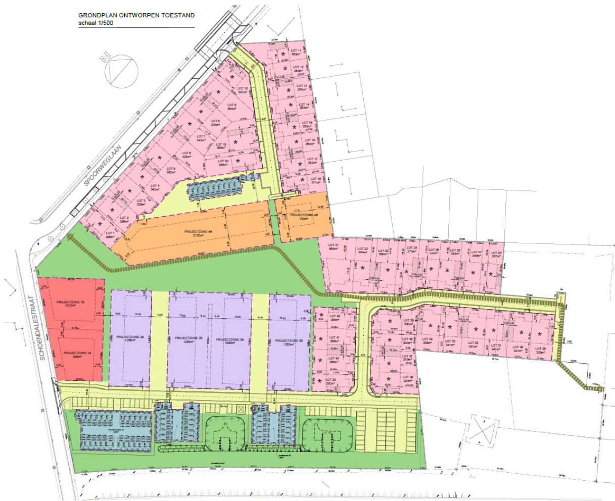
VERKAVELING SPOORWEGLAAN WAREGEM