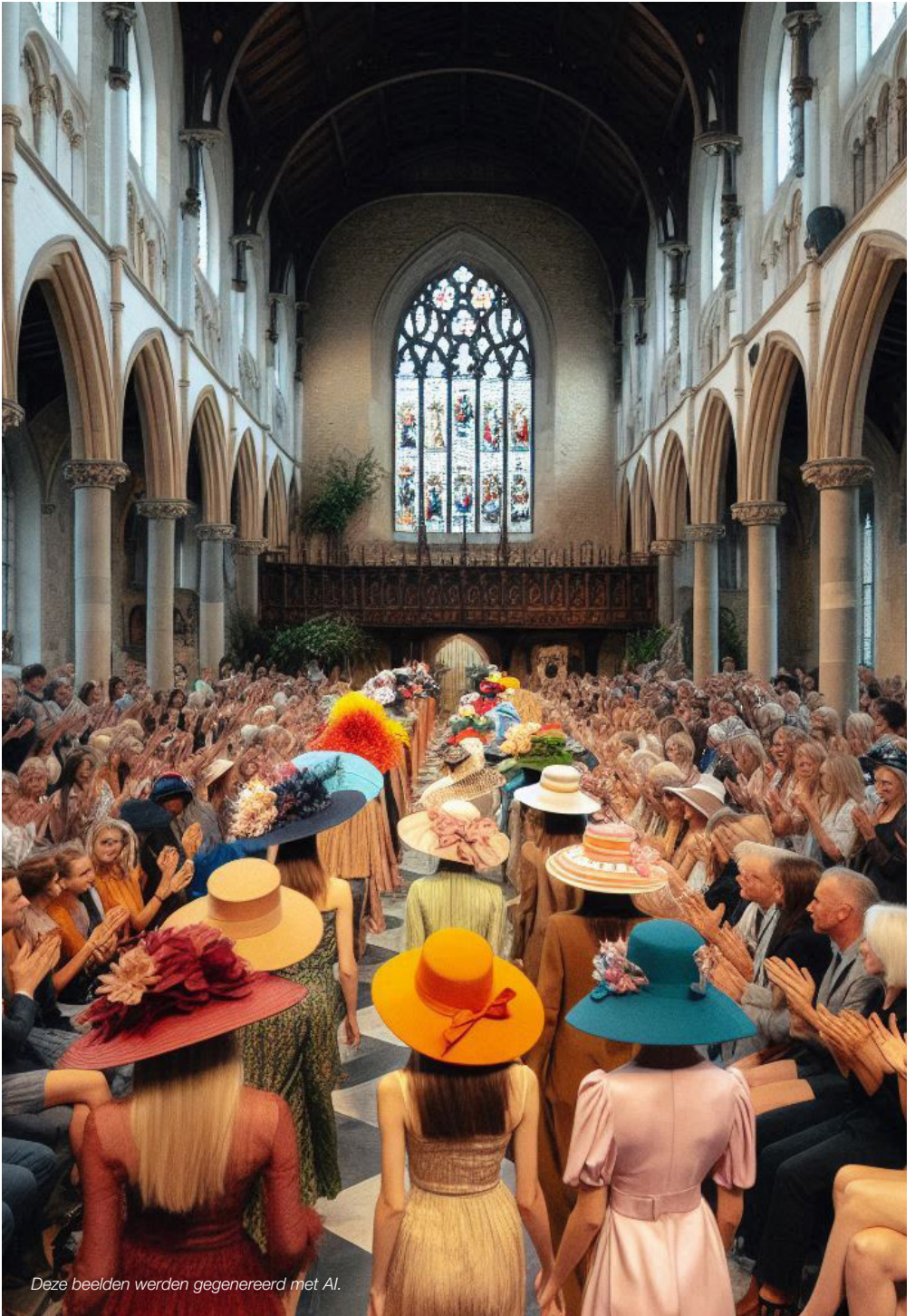
Deze beelden werden gegenereerd met AI.